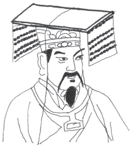
Gele Keizer? 2599 v.Chr.