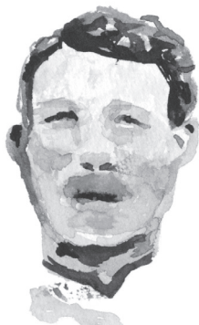
Apau ca. 1880-?